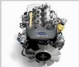
เครื่องยนต์ DURA TORQ คอมมอนเรล • 3.0 ลิตร 156 แรงม้า แรงบิด 380 นิวตัน-เมตร • 2.5 ลิตร 143 แรงม้า แรงบิด 330 นิวตัน-เมตร