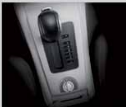
เกียร์อัตโนมัติ 5 สปีด อัตราทดัด ให้อัตราเร่งที่ต่อเนื่องและประหยัดน้ำมันกว่า เกียร์อัตโนมัติแบบ 4 สปีดทั่วไป