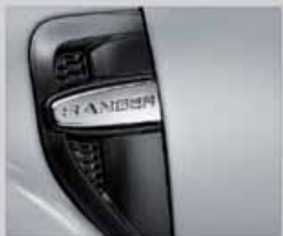
สัญลักษณ์เรนเจอร์ด้านข้างสไตส์รถนอกประมง