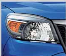
ไฟหน้าแบบวีลดีร์ฟลักเตอร์ในคอนำสไตส์สปอร์ต