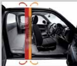
เน้นใจได้ในความปลอดภัยกับโครงสร้าง Double B Pillar เสริมเหล็กนิรภัย ในโครงสร้างประตูหน้าและบานพับ ทำหน้าที่เหมือนปราการนิรภัย 2 ชั้น ปกป้องคุณจากการชนด้านข้าง