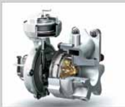
ติดตั้งเทอร์โบในเครื่องยนต์ทั้งเครื่อง 3.0 และ 2.5 ลิตร ให้แรงบิดมา อย่างต่อเนื่องสม่ำเสมอทุกย่านความเร็ว