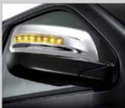
กระจกมองข้างพร้อมไฟเลี้ยวในตัวแบบ LED