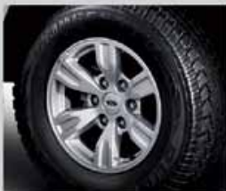
ล้ออัลลอยไฟโชนแรงขนาด 16 นิ้ว